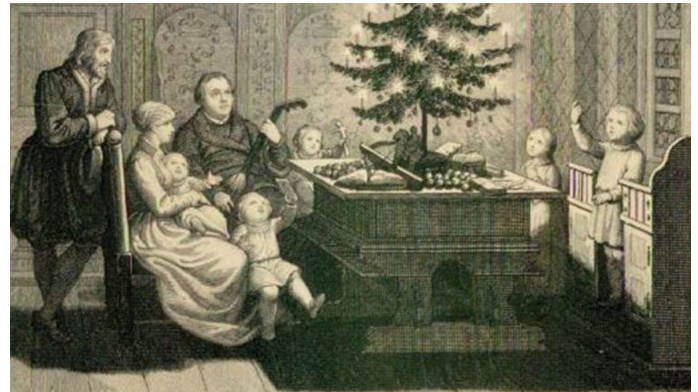
(Sketch, Carl August Schwerdgeburth [1845]).

en Cristo. Ninguno de los que realmente lo ha hecho se arrepintió jamás.